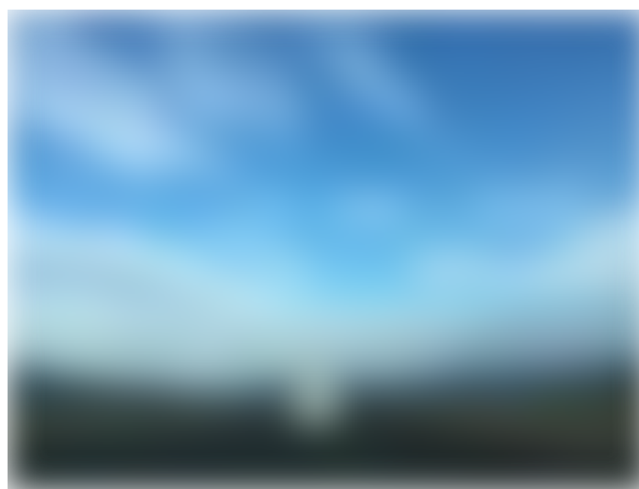
„Við höfum til dæmis unnið fyrir fyrirtæki í ferðaþjónustu, fólk í ýmiskonar verktakaþjónustu, listamenn, fyrirtæki í heilbrigðisgeiranum og góðgerðasamtök“

Ólafur segir að viðskiptavinirnir séu oftast með einhverja hugmynd um eftir hverju þeir eru að leita, þó hugmyndirnar séu vissulega mislangt á veg komnar. „Við vinnum áfram með þá hugmynd sem viðskiptavinurinn hefur. Þegar við höfum gert uppkast er það sent fram og aftur á milli viðskiptavinarins og starfsmanna okkar, þar til viðskiptavinurinn er orðinn ánægður“ segir Ólafur. „Þegar vinnan við vefsíðuna hefst er það gert í rauntíma svo að hægt er að fylgjast með á vefnum og koma með uppástungur og ábendingar ef viðskiptavinurinn hefur aðra sýn.“