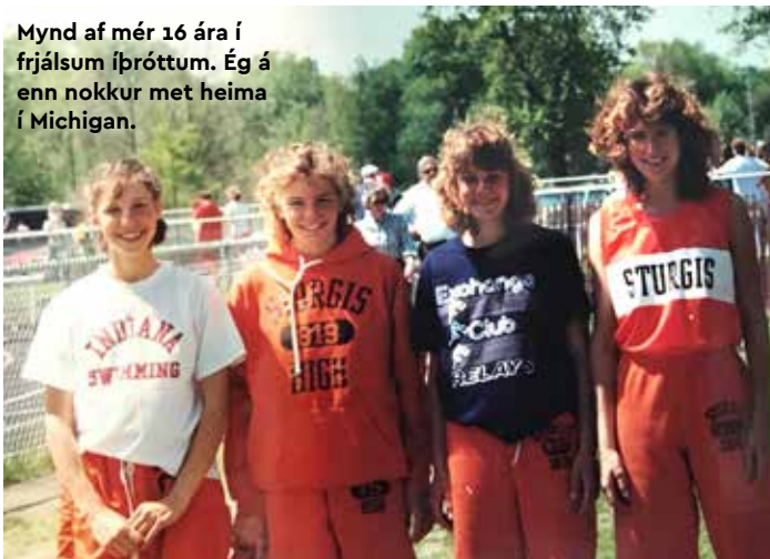
Mynd af mér 16 ára í frjálsum íþróttum. Ég á enn nokkur met heima í Michigan.