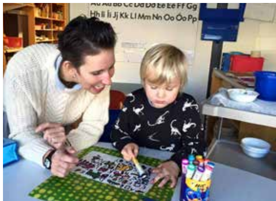
Leikskólastjóri í leikskólanum Ösp (myndin af barninu er birt með samþykki móður).

„Ég hafði ekki efni á að greiða fyrir íslenskunámskeið og datt í hug að fara að vinna á leikskóla svo ég myndi læra tungumálið.“