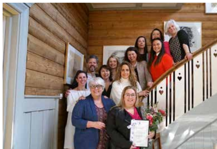
Mynd af okkur í W.O.M.E.N. að taka á móti Mannréttindaverðlaunum Reykjavíkurborgar.