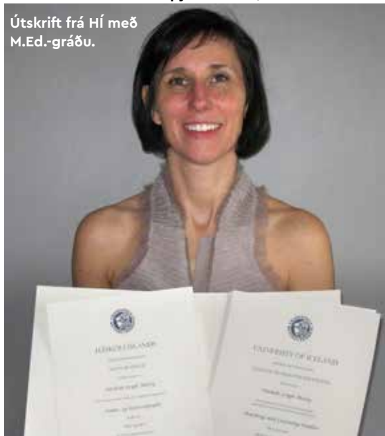
Útskrift frá HÍ með M.Ed.-gráðu.

vann á leikskólanum. Það var kona sem vann í eldhúsinu en ég vann inni á deild. Við vorum báðar dálítið neikvæðar um okkar stöðu, sátum oft saman og töluðum um hvað þetta var allt glatað. Á þessum tíma áttaði ég mig ekki á að það voru ýmsir hlutir sem voru á réttri leið. Til dæmis var ég loksins farin að læra tungumálið.“