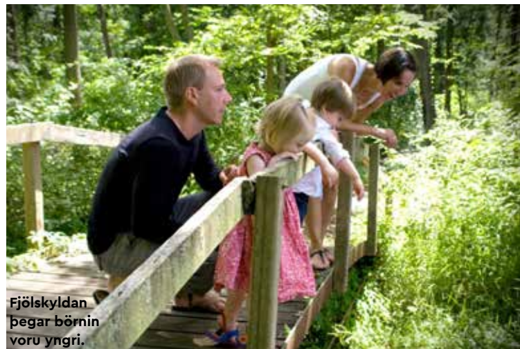
Fjölskyldan þegar börnin voru yngri.